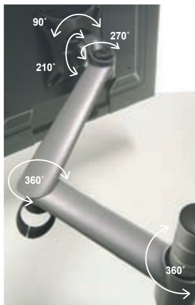
*flexible movement joints and full reach of 440mm Max.

Zorroは、耐久性に優れたアルミダイカストとグラスフィールドナイロンプラスチックで構成された、VESA対応の液晶モニターです。オプションで各種ブラケットをご用意していますので、あらゆる場所に取付け可能です。